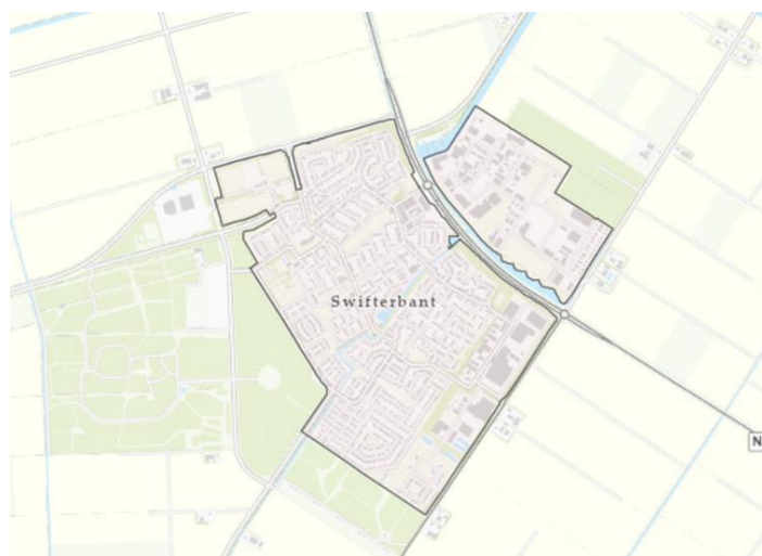
Figuur 2: Omtrek van bebouwde dorpskern van Swifterbant, waarvoor de Near-to-zero afspraak geldt.

opgenomen in Bijlage 1 van dit monitoringsplan. Ondanks dat deze woningen hiermee niet langer als gevoelig object worden getoetst aan de normering uit het Activiteitenbesluit en de Activiteitenregeling, is ook voor deze woningen de slagschaduwduur inzichtelijk gemaakt.