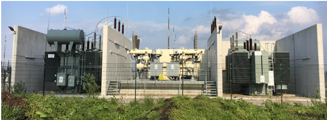
Windmolen Park Urk