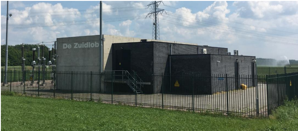
Windmolen Park De Zuidlob Zeewolde