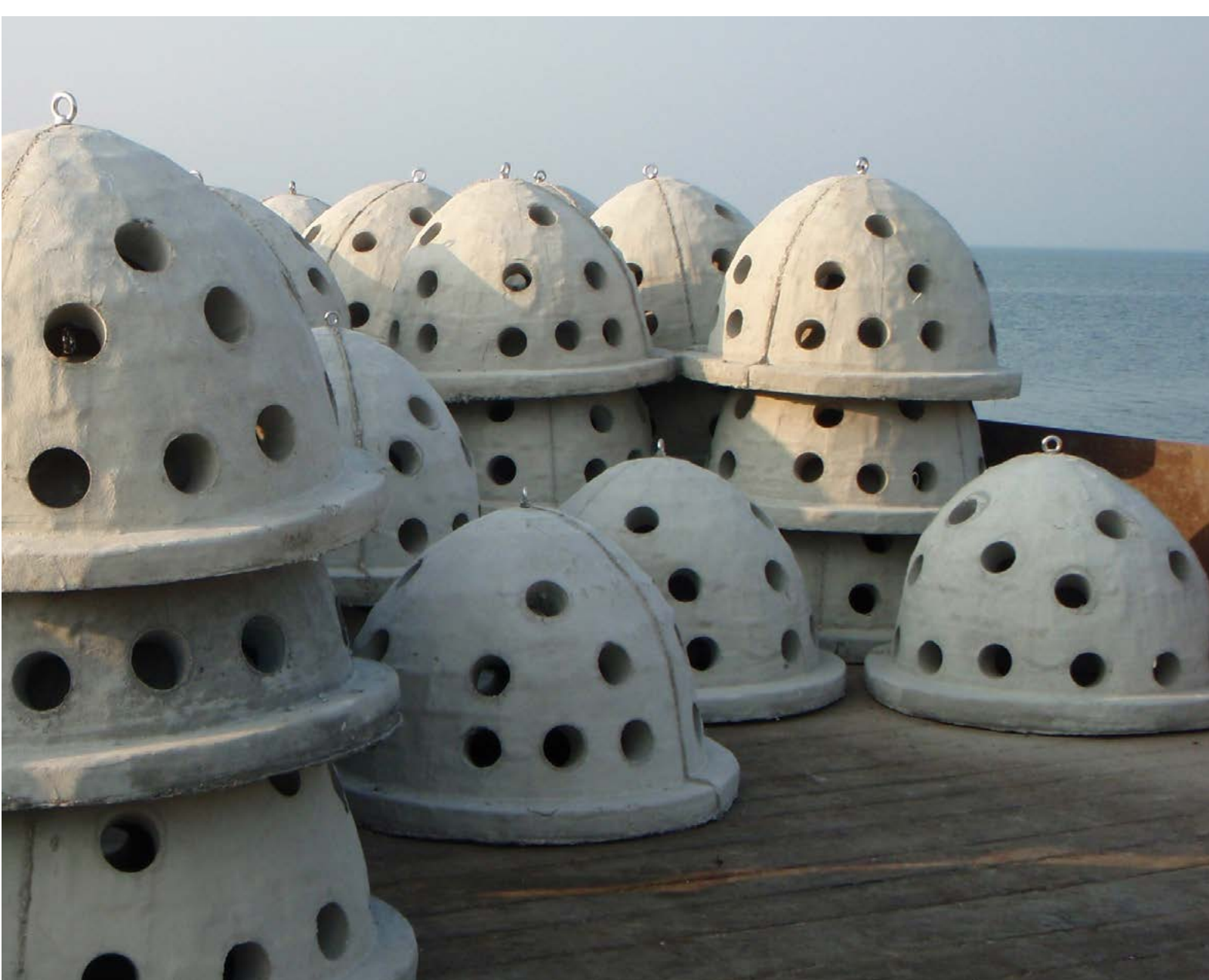
Rifballen boven water